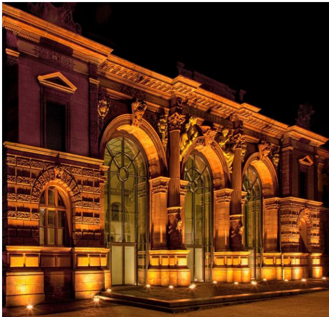
Forum Alte Post