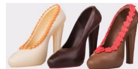
WAWI-Euro GmbH Fotos: Ralf Fink