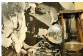
Stadtmuseum Altes Rathaus

Eine Auswahl aus einer der größten Schuhsammlungen der Bundesrepublik mit über 20.000 Paar Schuhen aus allen Epochen gewährt Einblicke in dieses Handwerk und einen modischen Industriezweig. Besucher können anhand eines Gebrauchsgegenstandes und Kulturguts eine interessante Zeitreise unternehmen. Das Deutsche Schuhmuseum im nahegelegenen Hauenstein bietet einen spannenden Einblick in die Details der Schuhherstellung.