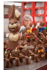
WAWI-Euro GmbH