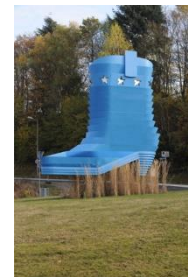
Kreisel - Fabrikverkauf

Doch nicht nur modisches Schuhwerk können Besucher in der Deutschen Schuhmetropole erstehen. Die Schokoladenmacher von Wawi bieten ein unvergessliches Erlebnis rund um die süßeste Versuchung. Wie wird der Schokohase eigentlich geboren? Ist er eitel, weil er geschminkt wird? Dies und einiges mehr erfahren Besucher bei einer Führung durch die Gläserne Produktionsstätte mit kleinem Museum. Ein gut sortierter Fabrikverkauf mit Cafeteria schließt sich an.