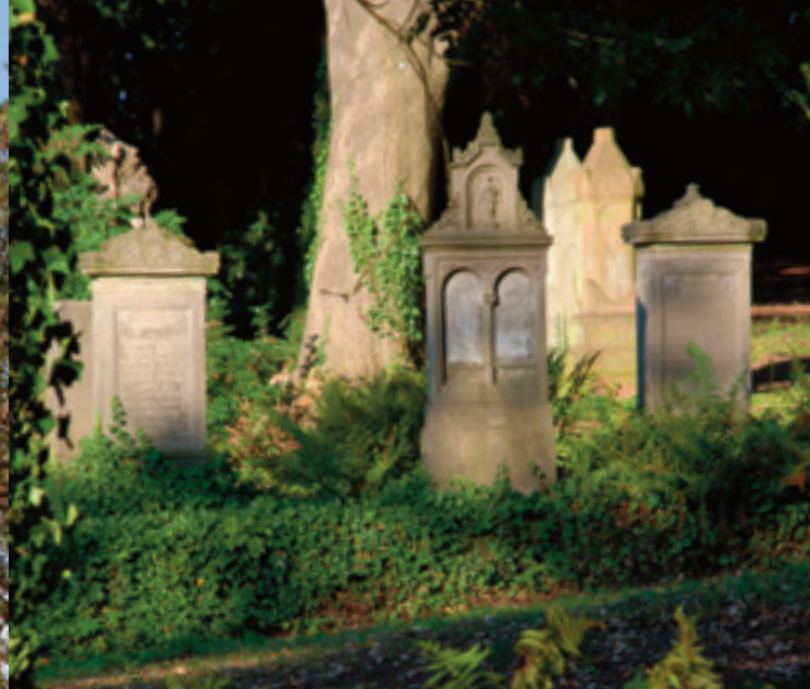
Skulpturenpark "Alter Friedhof" in Pirmasens