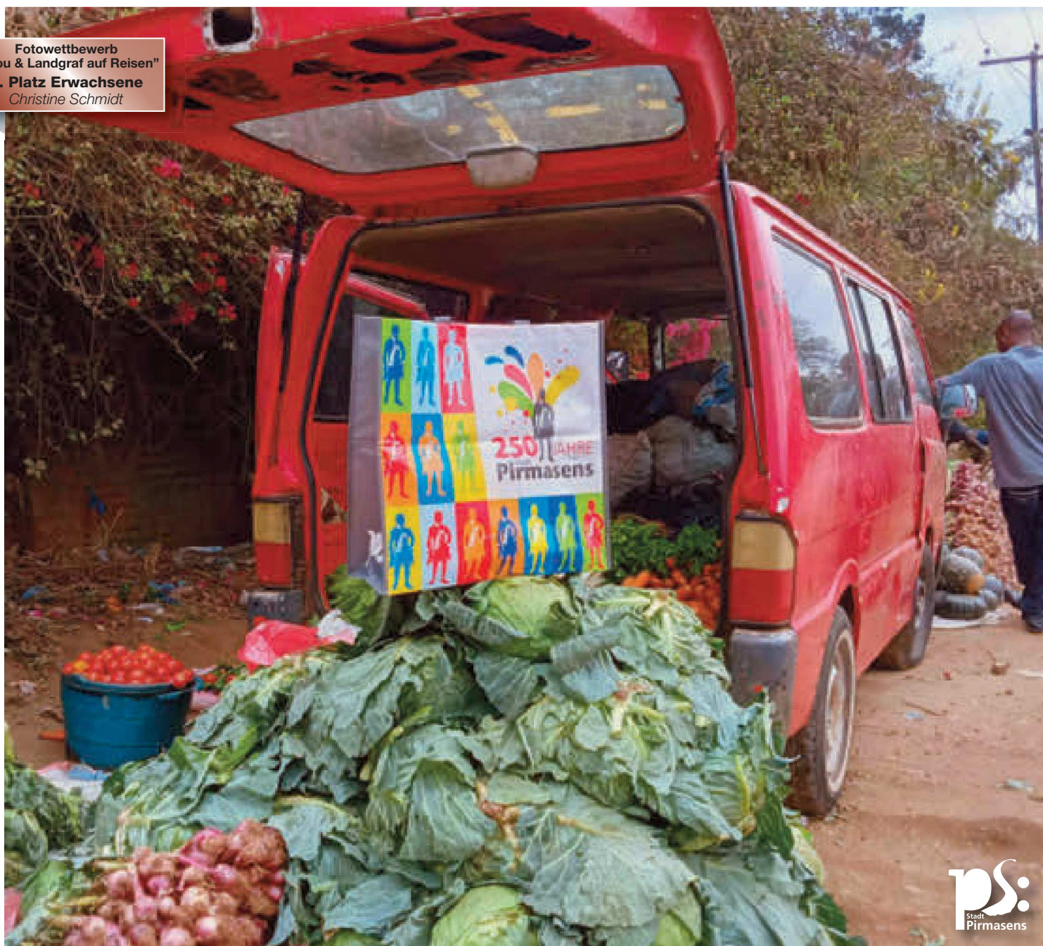
Fotowettbewerb "Pilou & Landgraf auf Reisen" 3. Platz Erwachsene Christine Schmidt