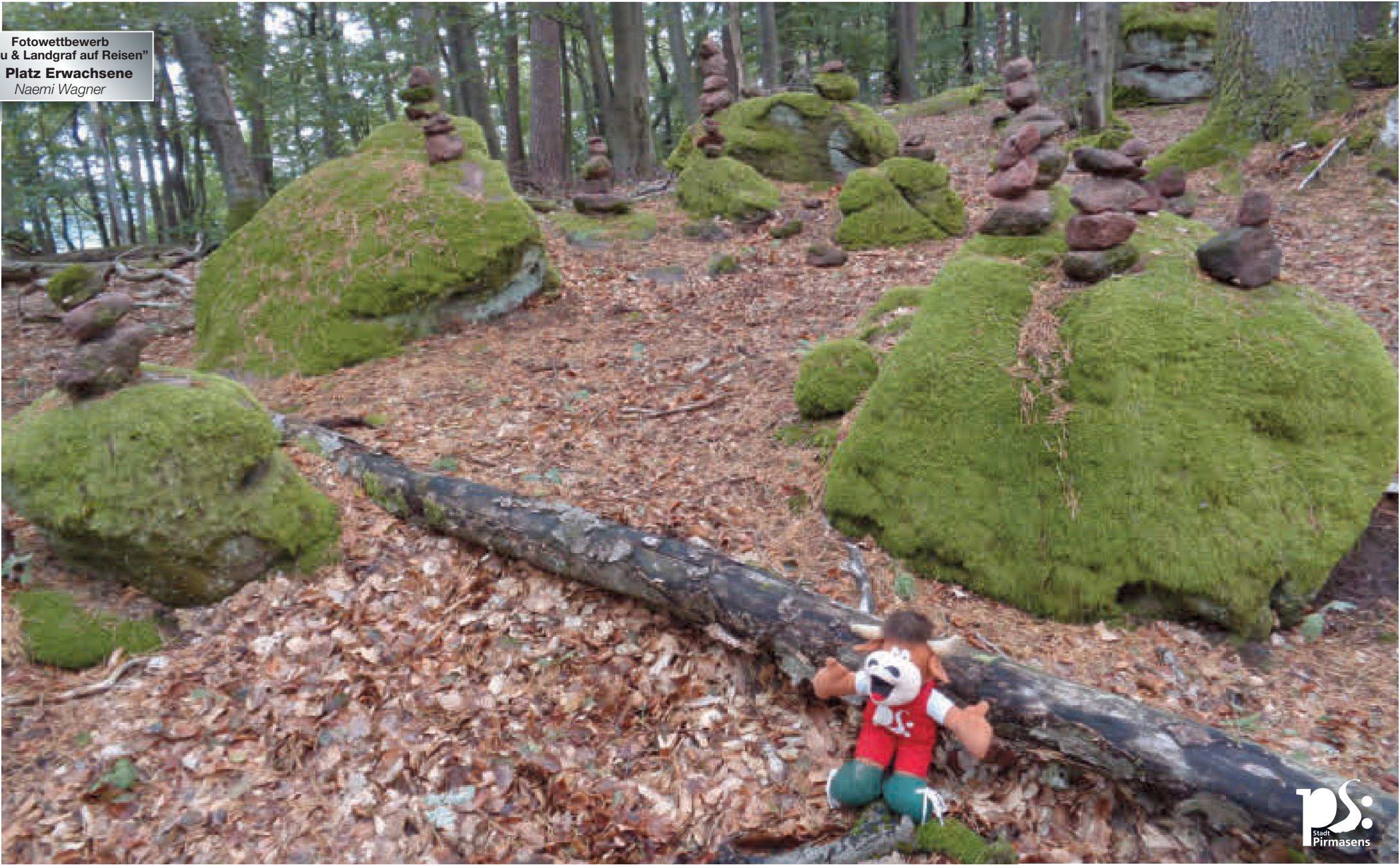
Fotowettbewerb "Pilou & Landgraf auf Reisen" 2. Platz Erwachsene Naemi Wagner