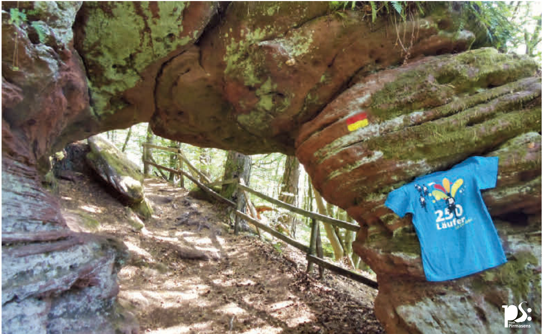
Fotowettbewerb "Pilou & Landgraf auf Reisen"