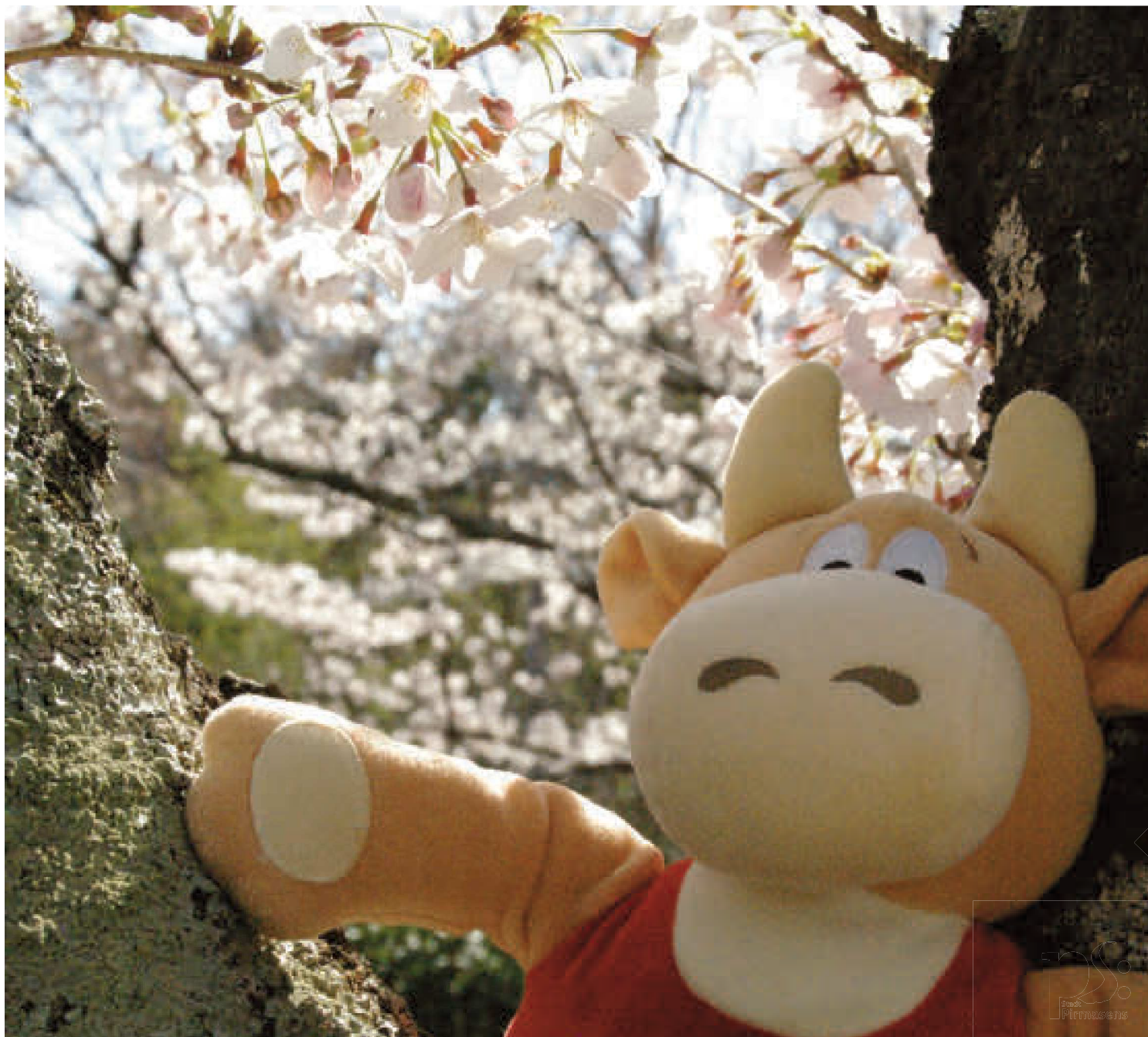
Fotowettbewerb "Pilou & Landgraf auf Reisen" | Foto: Susanne Nakamoto