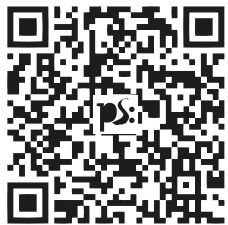
QR-Code zum Audioguide

Alternativ kann der hörbare, knapp einstündige Stadtrundgang auch direkt über den nachfolgenden QR-Code abgerufen werden: